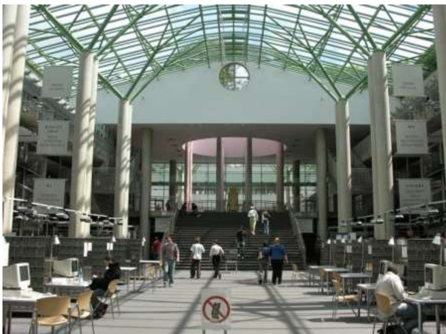
Рис.9 Архитектурная мастерская “Budzynski & Badowski”

Протяжённый неф каталожного зала, стеклянный купол над средокрестием осей, ритмичный шаг спаренных колонн, отделяющих три уровня «хор» – сакральная символика буквально пронизывает главное пространство библиотеки.