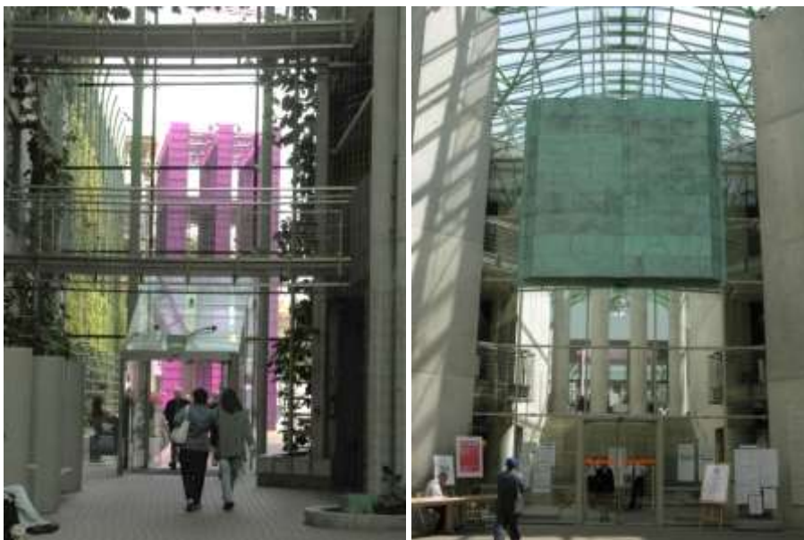
Рис.6 На стеклянной стене медная книга с латинской надписью: Hinc Omnia (Отсюда все).

По концам «Улички» расположены - два входа в комплекс.