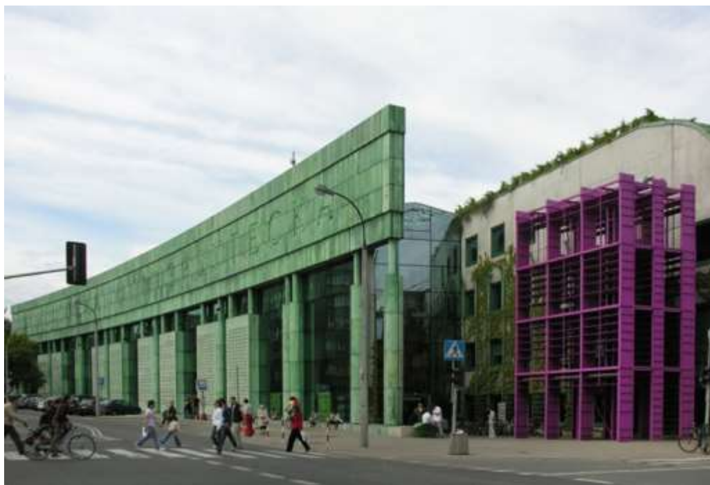
Рис.4 Вид на главный фасад

Библиотека имеет два подземных и четыре наземных этажа. Конкурсное задание предусматривало создание дополнительной коммерческой зоны на территории библиотеки. Поэтому первый подземный этаж практически весь занят торговлей, сервисными мастерскими, книжными магазинами и т.д. (этаж -2, как обычно, отдан паркингу). Нулевой уровень библиотеки (1 этаж) занят, в основном, фондами. Главные публичные пространства располагаются на втором этаже, третий и четвёртый вмещают читальные залы и служебные помещения.