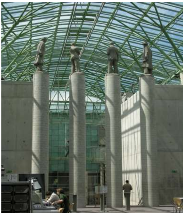
Рис.8 Основное здание. Постройка, 2000. Фотография © Архитектурная мастерская "Budzynski & Badowski"

В глубине открывающейся перспективы зала ещё одна лестница ведёт к окружённой колоннами ротонде под стеклянным куполом. Это место пересечения трёх перпендикулярных осей координат: вертикальной и двух горизонтальных. Под ротондой находится главная сокровищница библиотеки – закрытые фонды, отделённые от верхних уровней стеклом. Таким образом, вся вертикальная ось напоминает символический колодец, откуда можно черпать знания. Стеклянный купол пропускает таинственные лучи розоватого света как нити, связывающие «колодец знаний» со вселенной.