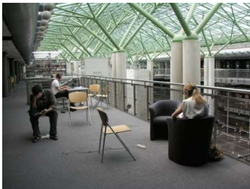
Рис.10 Металлические ветви поддерживающие стеклянную крышу

Через пространство главного холла переброшен стеклянный мостик, с которого можно разглядеть в доступной близости каменных чудачков-философов, венчающих входные колонны. Ветви загадочных металлических деревьев окружают верхний ярус.