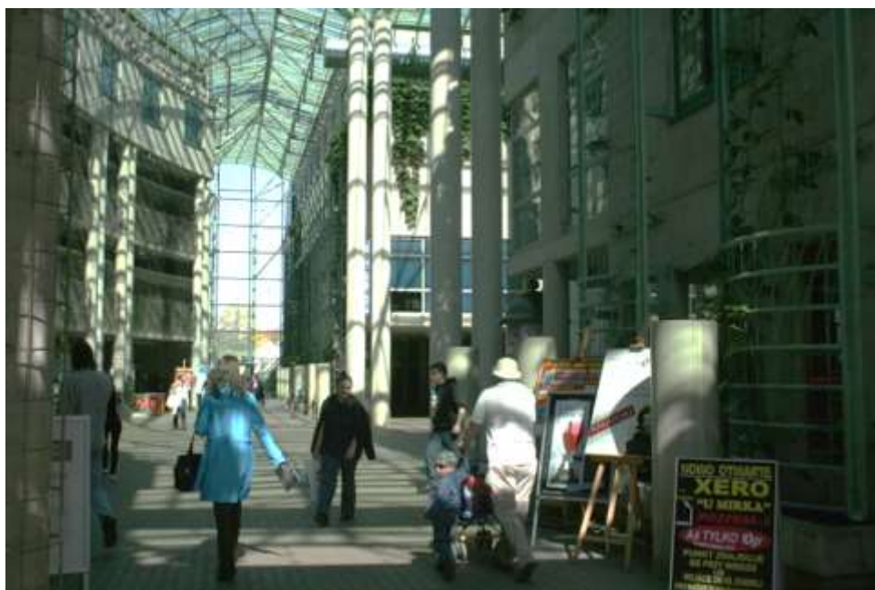
Рис.5 «Уличка» - пешеходный променад с верхним остеклением.

Наземный объем разделен на две неравные части, между которыми проходит «Уличка» - пешеходный променад с верхним остеклением. На перпендикулярной «Уличке» оси расположены символические ворота «Святыни знаний», над которыми парит укрепленная на стеклянной стене медная книга с латинской надписью: Hinc Omnia (Отсюда все).