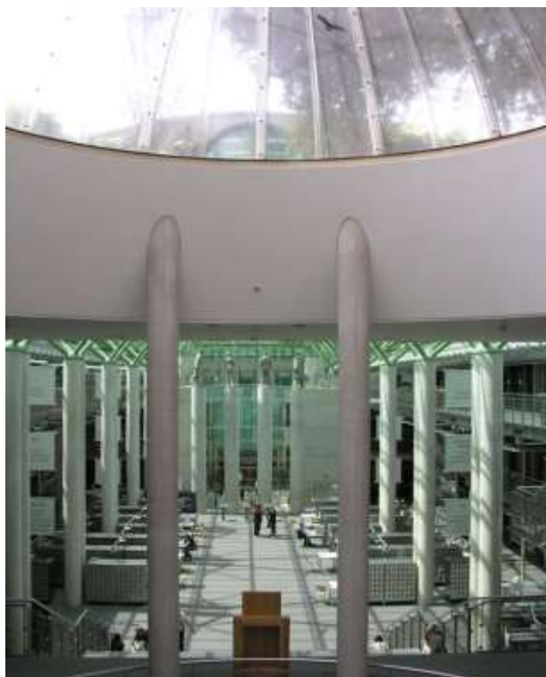
Рис.10 Протяжённый неф каталожного зала, стеклянный купол

Протяжённый неф каталожного зала, стеклянный купол над средокрестием осей, ритмичный шаг спаренных колонн, отделяющих три уровня «хор» – сакральная символика буквально пронизывает главное пространство библиотеки.