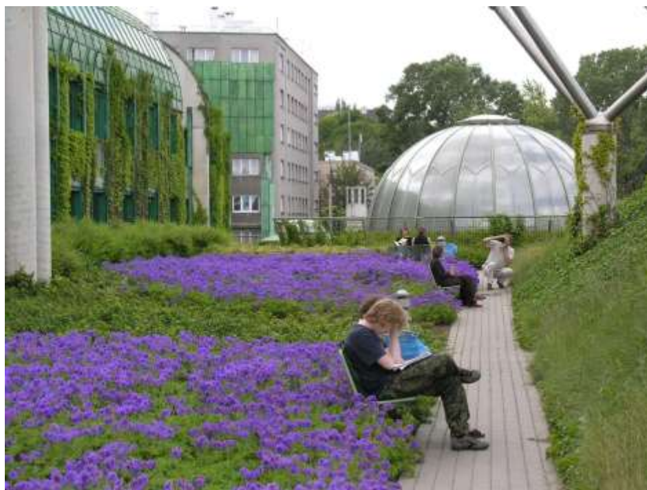
Рис.2 Библиотека Варшавского университета. Постройка, 2000.