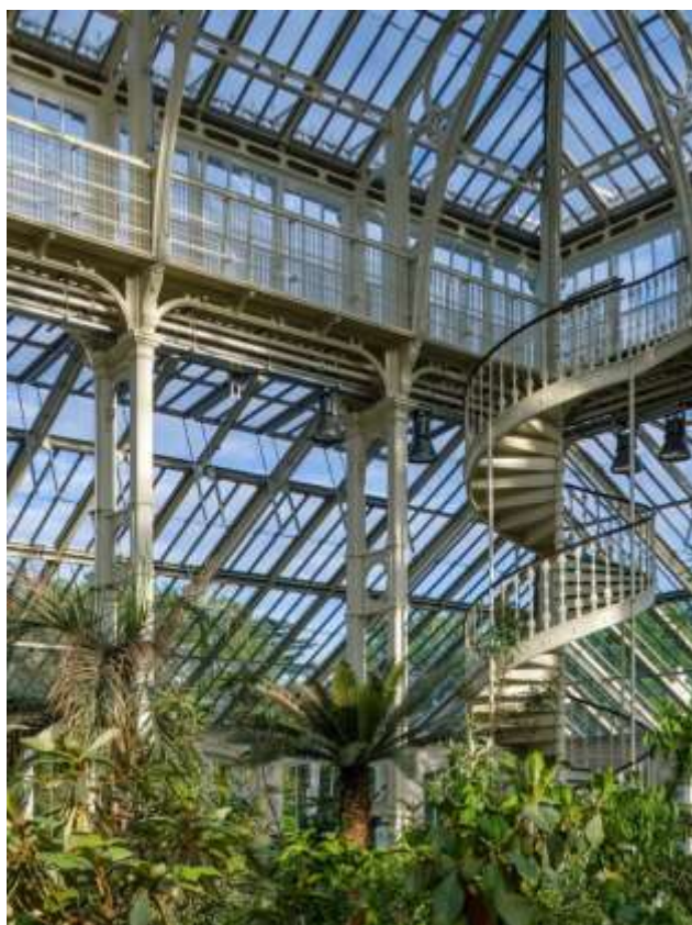
Рис.13 Оранжерея с винтовой лестницей

Наземные ярусы, помимо двух широких лестничных маршей на главной оси, объединены четырьмя вертикалями изящных винтовых лестниц по обе стороны от главного нефа. Все пять уровней библиотеки связаны семью стволами коммуникаций с лифтами и пожарными лестницами.