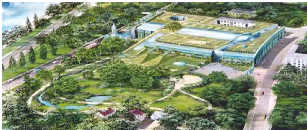
Рис.2 Генеральный план Постройка, 2000. Фотография © Архитектурная мастерская "Budzynski & Badowski"