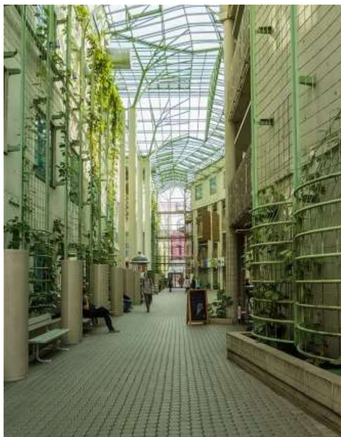
Рис.12 «Уличка» - пешеходный променад с верхним остеклением.

Одним из главных достоинств проекта члены конкурсного жюри называли «эластичность» пространств, возможность их трансформации под меняющиеся нужды библиотеки.