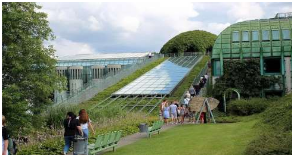
Рис. 1 Плавный переход зеленого массива на крышу здания.

В 1993 году был объявлен открытый международный конкурс на проект нового здания, в котором победил Марек Будзинский и его соавтор Збигнев Бадовский с коллективом. Победители конкурса предложили сделать ботанический сад университетским, объединив его в одно целое с эксплуатируемой кровлей: зеленый массив «плавно взбирается» на крышу здания, образуя единое пространство.