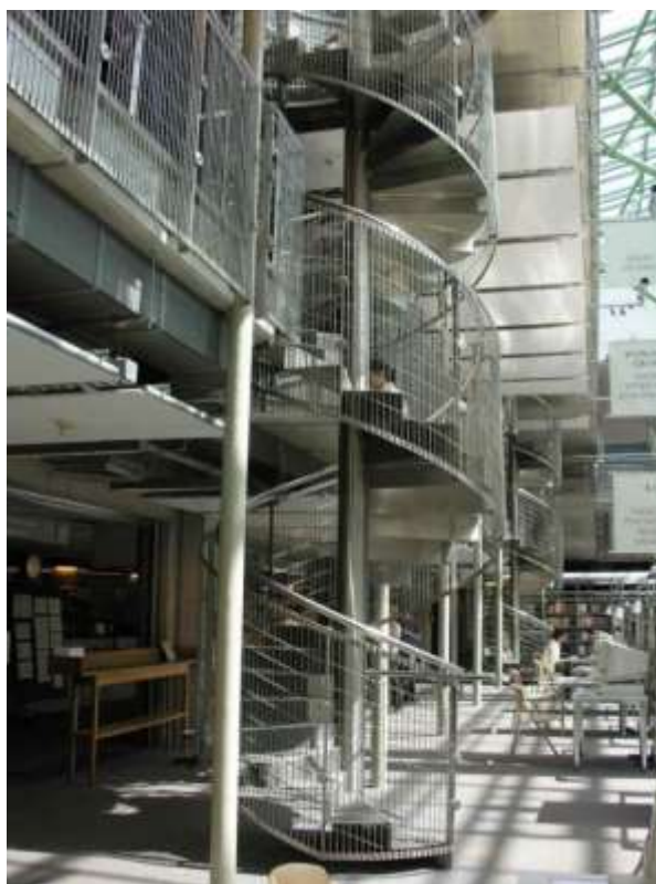
Рис.14 Винтовая лестница

Выводы. Важно отметить, что при высокой технической оснащённости и наличии верхнего сада, стоимость библиотеки получилась относительно умеренной – в первую очередь, за счёт использования бетона как основного строительного материала.