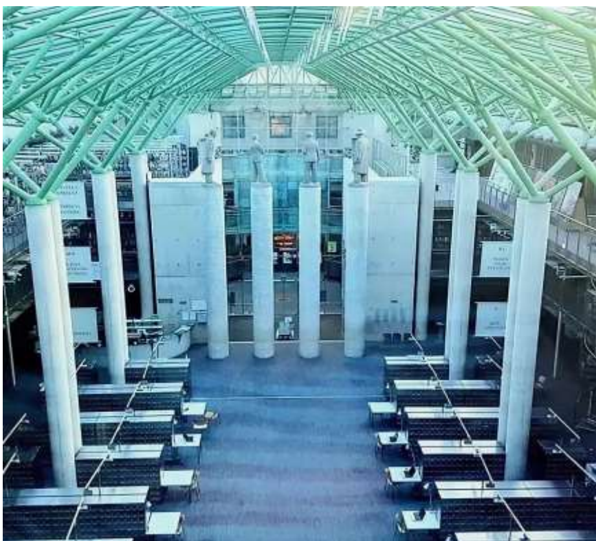
Рис.7 Колоннада философов

Колоннада философов – это простые вытянутые цилиндры из грубого бетона, без баз, энтазиса и капителей, ставшие постаментами для четырёх реалистичных скульптур польских мыслителей. Обращает на себя внимание полное отсутствие патетики, мягкая, добрая интонация и искра юмора в трактовке их образов.