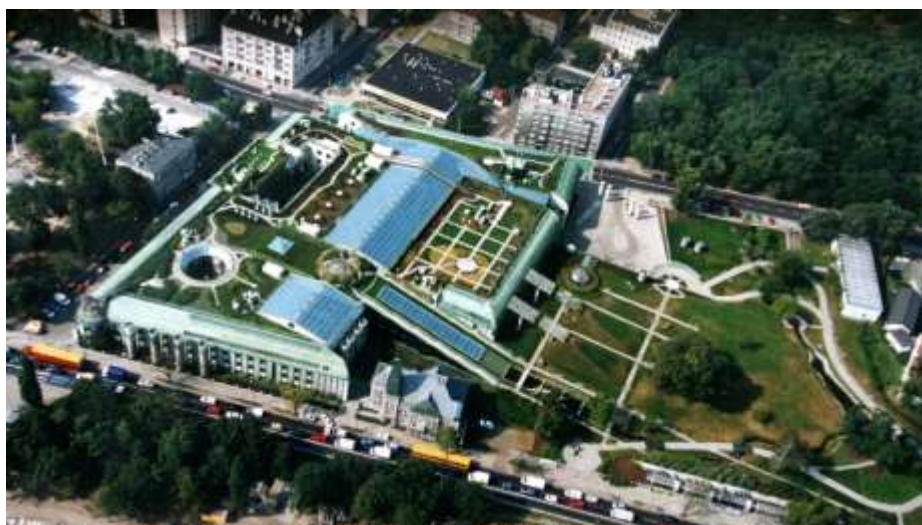
Рис.3 Вид с высоты птичьего полёта. Постройка, 2000.

Фотография © Архитектурная мастерская “Budzynski & Badowski”