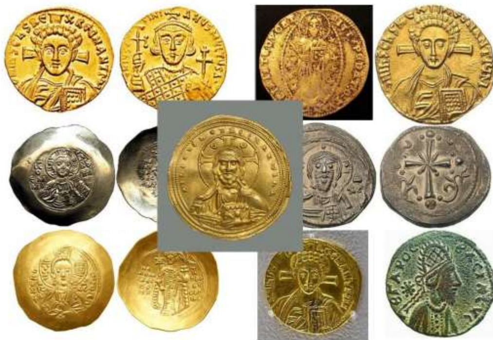
Рисунок №2. Примеры средневековых монет с изображением Иисуса Христа. В центре находится первый золотой солид с каноническим ликом Иисуса Христа, начало XI века.

Библейские события Нового Завета, согласно автору, происходили в 909–910 годах на огромной территории. Пришел Иисус Христос через Дамаск, где уже была Мечеть Омейядов, одну из башен которой назвали в честь Иисуса. Затем Спаситель на берегу реки Иордан был крещен своим родственником Иоанном Предтечей. Потом он отправился в Эль Кудс / Иерусалим, где побывал в Храме Соломона – Мечети Куббат Ас-Сахра. Откуда он попал на побережье Средиземного моря и на судах и пешком направился с учениками в Константинополь. Иисус побывал на Афоне, где в горах провел Нагорную проповедь и поддержал в своих трудах местных монахов.