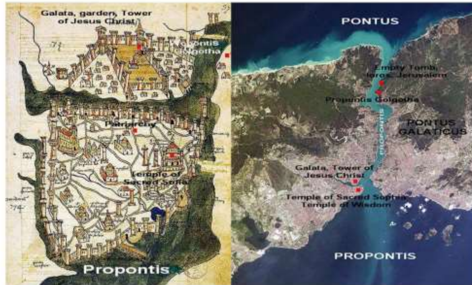
Рисунок № 3. Святые места Нового Завета Константинополя на древней карте (1422 г.) и на виде из космоса.

Церковь была разрушена в XV веке и сейчас там стоит мечеть Фатих. Столб бичевания Иисуса Христа хранится ныне в церкви Св. Георгия (современная Патриархия). Иисуса осудили на смерть правочерные христиане, а не иудеи. Патриархом тогда был Сергей II Студит. Согласно традиции, претендента на статус Мессии отправили на распятие на Животворящем кресте.