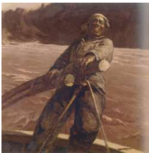
Ил.3 钟涵 《山雨欲来》1982年, 布面油画, 115x106cm 中国美术馆藏

Чжун Хань "Горный дождь идет", 1982г, холст, масло, 115x106см. Собрание Национального художественного музея Китая.