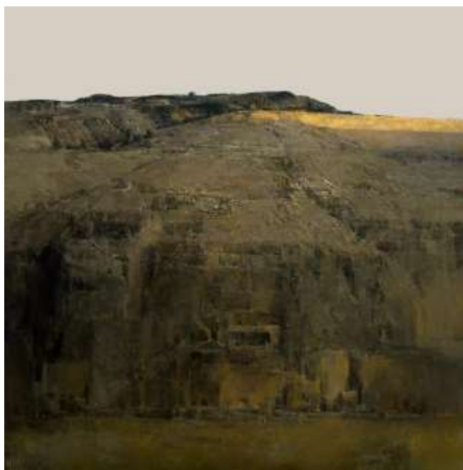
Ил.5 黄胜贤《塬上人家-暖阳》2010年，布面油画，180x180cm。