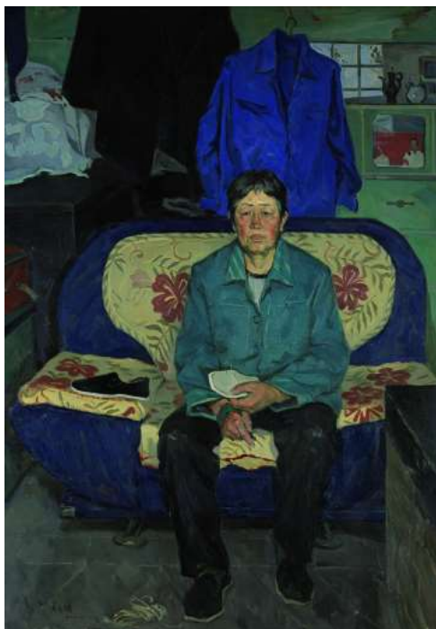
Ил.2 黄远鹏《新鞋》2012年, 布面油画, 160x120cm 中国艺术研究院油画院美术馆

Ян Фэйюнь 《Настойчивость》 2009г, холст, масло, 130x97см, Музей Академии масляной живописи Китайской Академии художеств