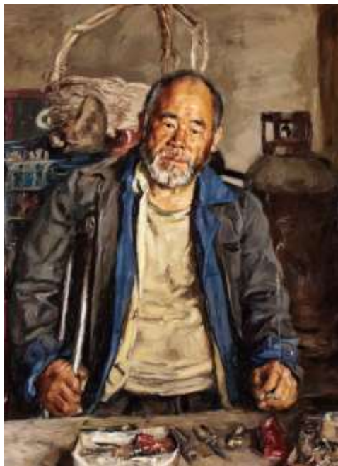
Ил.1 杨飞云《坚毅》2009年, 布面油画, 130x97cm, 中国艺术研究院油画院美术馆

Ян Фэйюнь 《Настойчивость》 2009г, холст, масло, 130x97см, Музей Академии масляной живописи Китайской Академии художеств